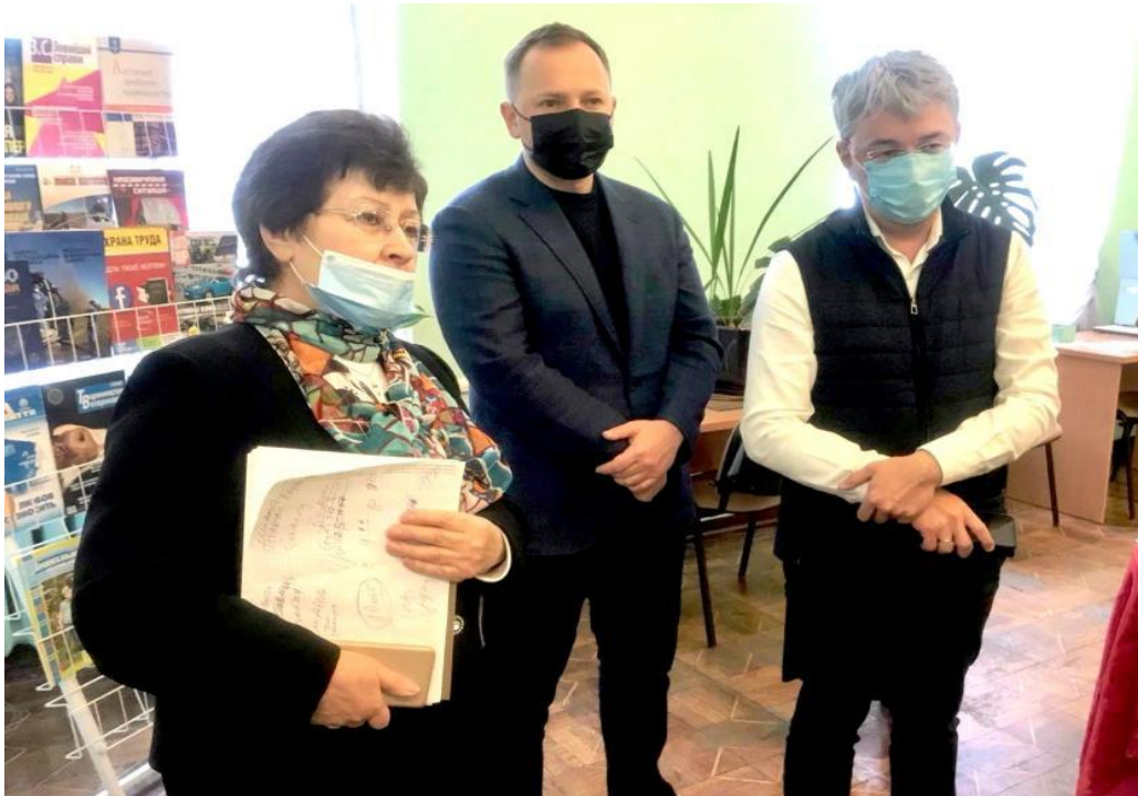
Міністр культури та інформаційної політики України О. В. Ткаченко ( крайній справа ) під час робочого візиту до Харкова відвідав ХДНБ. м. Харків, жовтень 2020 р.